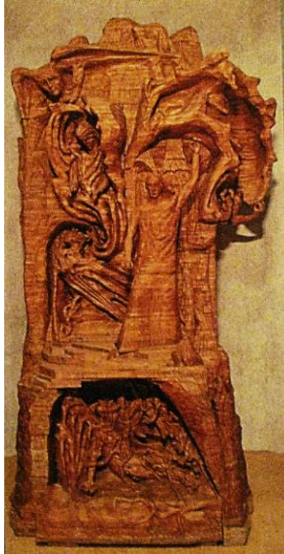
El representante del Hombre

“Estamos infundiendo esta configuración de la relación entre Cristo, Lúcifer y Áhriman en nuestro edificio de Dornach porque la Ciencia del Espíritu nos revela de cierta manera que la próxima tarea relacionada con la comprensión del impulso de Cristo será hacer que el hombre finalmente entienda cómo Las tres fuerzas de Cristo, Lúcifer y Áhriman están relacionadas en este mundo. Hasta el día de hoy se ha hablado mucho sobre el cristianismo y el impulso de Cristo, pero el hombre todavía no ha adquirido una comprensión clara de lo que el impulso de Cristo ha traído al mundo como resultado del Misterio de Gólgota. Ciertamente, en general se admite que hay un Lúcifer o un Áhriman, pero al hacerlo, se hace ver que uno debería huir de estos dos, como si quisiéramos decir: "No quiero tener nada que ver con Lúcifer y Áhriman!"- En la conferencia pública de ayer, describí la forma en que se pueden encontrar las fuerzas divino-espirituales. Si estas fuerzas no quisieran tener nada que ver con Lúcifer y Áhriman, el mundo no podría existir. Uno no obtiene la relación adecuada con Lúcifer y Áhriman diciendo: